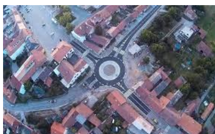
Postavení kruhového objezdu