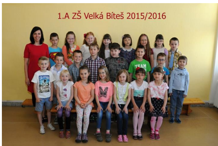
A my jsme vyrostli