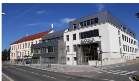
Rekonstrukce 1. stupně ZŠ