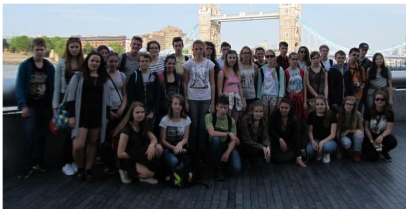
ZAHRANIČNÍ VÝJEZD ŽÁKŮ DO VELKÉ BRITÁNIE