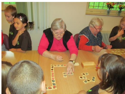
HRÁTKY V DOMĚ SENIORŮ