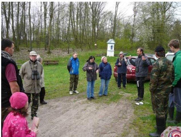
VÍTÁNÍ PTAČÍHO ZPĚVU