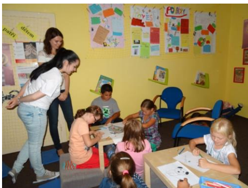
PROGRAM V MĚSTSKÉ KNIHOVNĚ