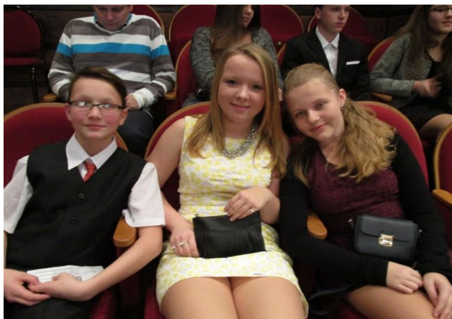
PODIVNÝ PŘÍPAD SE PSEM